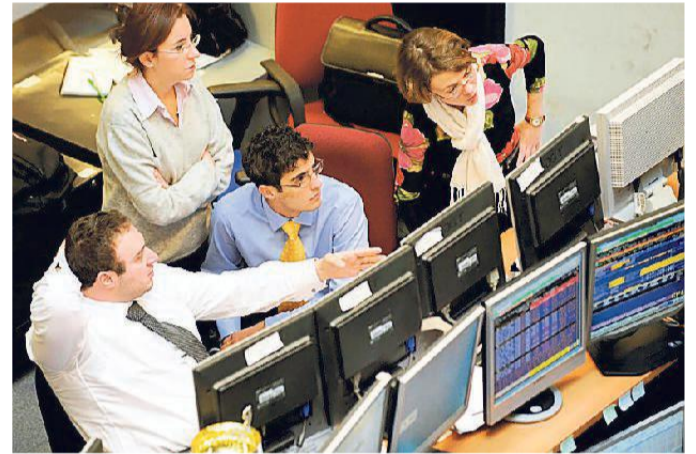
I dati sono raccolti da Ir Top Consulting, partner di Borsa Italiana-Lse Group