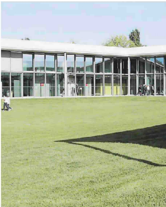
La sede di H-Farm

Fonte Osservatorio AIM Italia di IR Top Consulting su dati societari, Borsa Italiana e Factset. Market Cap al 17/12/2018 *44,4 mln di euro i ricavi pro forma